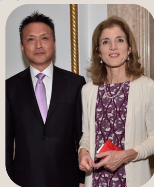
左：行政書士法人IMS 代表村井尚人 右：元駐日アメリカ合衆国大使 キャロライン・ケネディ氏 (大使公邸にて)

このアメリカビザ申請のノウハウを身に着けると、他の行政書士と差別化が図られ、事務所経営にとって非常に有益となります。是非今回の研修セミナーを受講いただき、皆様方の新しい事業展開にお役立ていただければ幸いです。